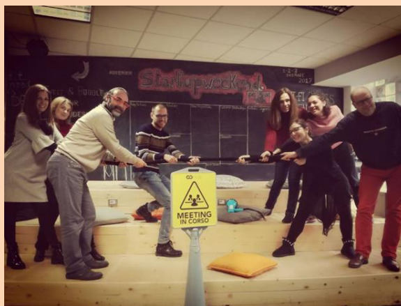
(Fotografia da primeira reunião em Itália)

Se quiser entrar em contacto connosco envie um e-mail para o seguinte endereço: hello@godesk.it